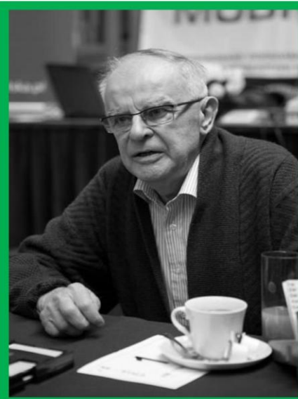
14. Memoriał Andrzeja Wilkosza